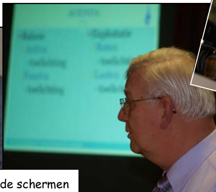
achter en voor de schermen