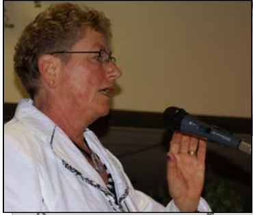
De voorzitter opent