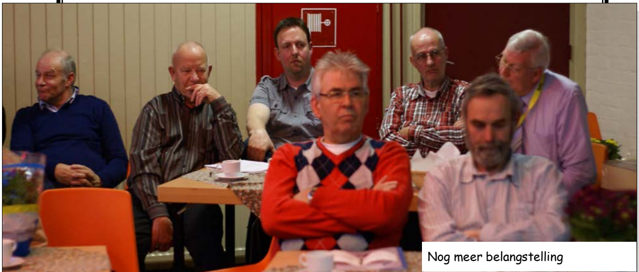
Nog meer belangstelling