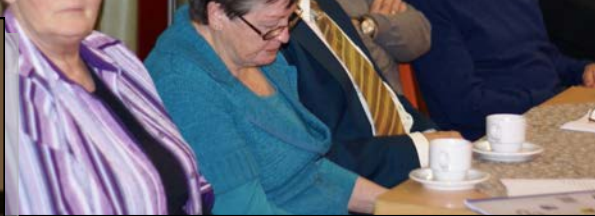
Het aandachtig gehoor