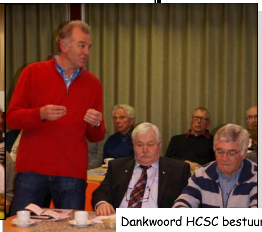
Dankwoord HCSC bestuur