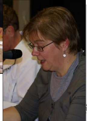
Het jaarverslag van de se