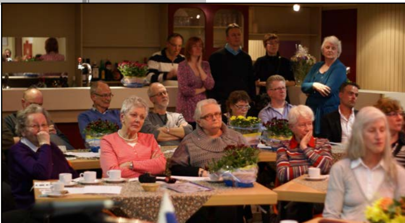
In de bloemetjes gezet