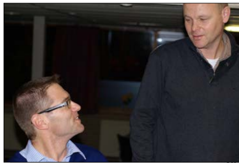
Overleg met de penningmeester